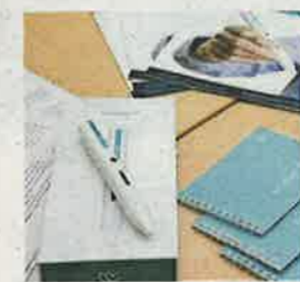
Die ersten 500 Stück des Medizinprodukts „Tremipen“ werden ausgeliefert

Dass Unternehmen wie Tremitas ihr Wissen mit jungen Gründern teilen, freut Hartlieb besonders. Nun wird im Herbst erstmals ein Weiterbildungsprogramm namens „Scientrepreneur“ an der FH verankert, Infrastruktur und Beratungen für Gründer werden weiterentwickelt, die Gründer-Community noch intensiver betreut.