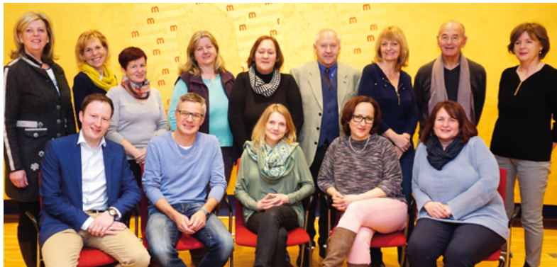
Aktion Demenz Moosburg

Toleranz - WIR HÖREN ZU Gemeinsamkeit - ALLE Verlässlichkeit Unterstützung Offenheit De - Mut zur Demenz