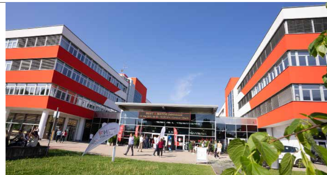
Die Meet & Match Karrieremesse am FH Campus Villach bietet eine Vielzahl an Möglichkeiten um seine beruflichen und akademischen Perspektiven zu erweitern

Villach. Hier kommen regionale und internationale Unternehmen mit potenziellen zukünftigen Arbeitnehmer zusammen, um persönliche Gespräche zu führen, Bewerbungsfotoshootings anzubieten, CV-Checks durchzuführen und Informa-